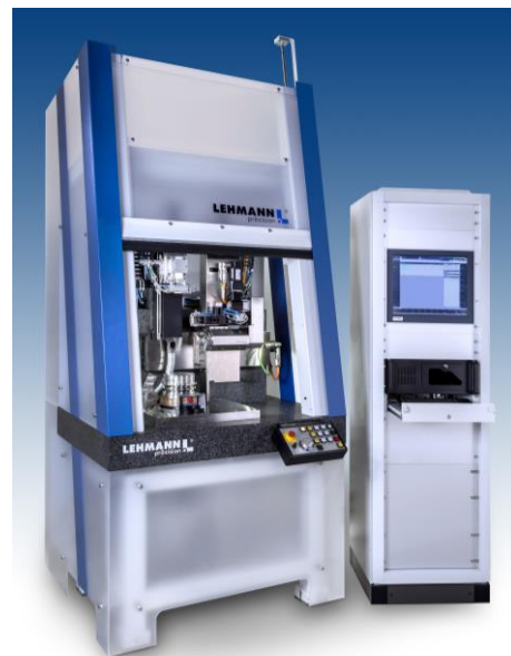
Tour d'ajustage pour la fabrication de lentilles