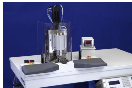
Fraiseuse CNC de précision pour micro-pièces

À partir de nos composants, nous construisons des tours, fraiseuses et machines spéciales spécifiques aux clients, pour l'usinage de petites pièces, qui satisfont aux exigences les plus sévères en matière de précision, de qualité et de sécurité du processus.